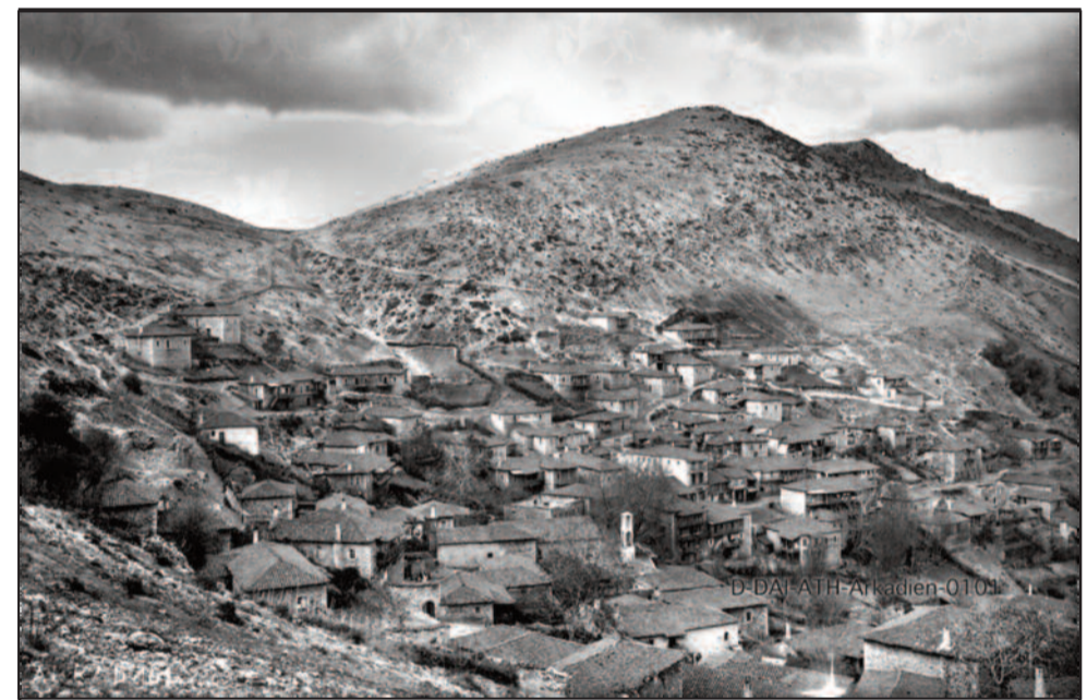
ΜΑΓΟΥΛΙΑΝΑ έτος 1910. Μόλις 90 χρόνια από την Επανάσταση και 110 χρόνια μέχρι σήμερα. Τα περισσότερα σπίτια παραμένουν ίδια. Λίγα είναι αυτά που δεν υπάρχουν πλέον. Χαρακτηριστικό το πέτρινο καμπαναριό του ΑηΓιάννη στη πλατεία που γκρεμίστηκε λίγα χρόνια αργότερα για να περάσει αμαξιτός δρόμος. Τα κλαδιά και η σκιά του πλάτανου απλώνονταν και τότε γύρω από όλη την υπάρχουσα πλατεία.

Πηγάς: «Ιστορία Γορτυνίας», Τάκης Κανδηλώρος, Πύργος 1898 «Ο Αρματολισμός της Πελοποννήσου, Τάκης Κανδηλώρος Αθήνα 1924.