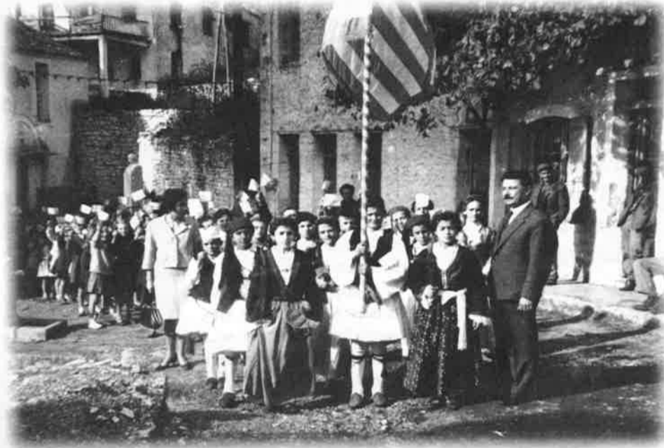
Επιστροφή στο... σχολείο. Μαθητριάς όπως τα αποθανάτισε ο φακός της φωτογραφικής κάμερας πριν από 35 χρόνια. Ο Δήμος Γόντικας έχει κάθε λόγο να καμαρώνει

ΤΟΥΣ ΜΑΓΟΥΛΙΑΝΙΤΕΣ δασκάλους τιμάει ο Πανελλήνιος Σύλλογος Μαγουλιανιτών την Κυριακή 15 Φεβρουαρίου 1998. Με την εκδήλωση αυτή τα μέλη του Συλλόγου επιθυμούν να τιμήσουν την προσφορά, αλλά και την μοναξιά των δασκάλων επαρχιακών σχολείων.