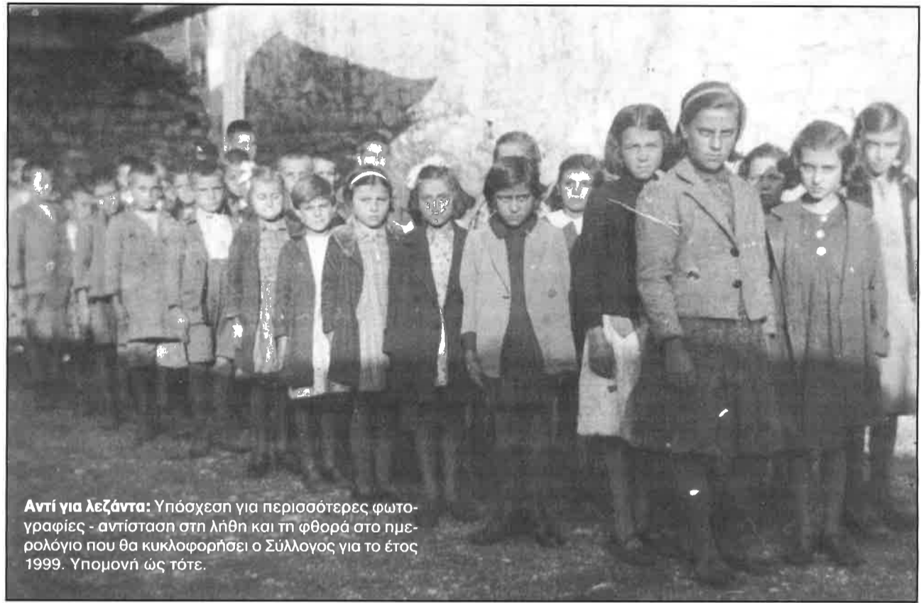
Αντί για λεζάντα: Υπόσχεση για περισσότερες φωτογραφίες - αντίσταση στη λήθη και τη φθορά στο ημερολόγιο που θα κυκλοφορήσει ο Σύλλογος για το έτος 1999. Υπομονή ως τότε.

Σας εύχομαι κάθε επιτυχία στο έργο σας και στις προσπάθειες που κάνετε για το καλό του Συλλόγου σας.