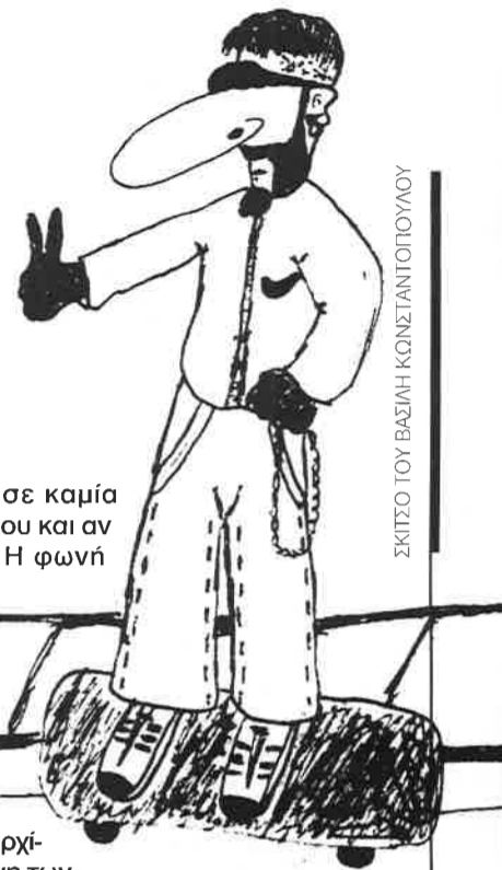
ΣΚΙΤΣΟ ΤΟΥ ΒΑΣΙΛΗ ΚΩΝΣΤΑΝΤΟΠΟΥΛΟΥ

ΣΤΗΝ ΠΡΟΕΚΚΛΟΓΙΚΗ ΠΕΡΙΟΔΟ που διανύουμε η εφημερίδα «Τα Μαγουλιανά» επιθυμεί ν' ανοίξει ένα «παράθυρο» στους υποψηφίους νομάρχες, δημάρχους, νομαρχιακούς και δημοτικούς συμβούλους. Ένα «παράθυρο» στη βάση προγραμματικών θέσεων για τα προβλήματα που απασχολούν το χωριό μας. Στόχος της εφημερίδας μας είναι να παρουσιάσει στους Μαγουλιανίτες ψηφοφόρους τα προγράμματα και τις συγκεκριμένες θέσεις των υποψηφίων που θα συμμετάσχουν στις προσεχείς νομαρχιακές και δημοτικές εκλογές του φθινοπώρου του 1998.