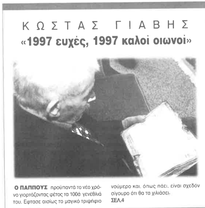
Ο ΠΑΠΠΟΣ προϋπαντά το νέο χρόνο γιορτάζοντας φέτος τα 100ά γενέθλιά του. Εφτασε αισίως το μαγικό τριψήφιο νούμερο και, όπως πάει, είναι σχεδόν σίγουρο ότι θα τα χιλιάσει. ΣΣΛ4

Ε πήγα και στη Μικρά Ασία. Εχουσα και εκεί το αίμα μου. Υπηρετούσα στη Θράκη και το Σύνταγμά μας πήγε στη Μικρά Ασία. Εξι χρόνια ήμουν στρατιώτης, στο πεζικό. Μας πήραν και μας πήγαν εκεί. Λαβώθηκα στο Τομπρούρ Ογλού. Πήγα στη Προύσα και από εκεί ήρθα με άδεια ως τραυματίας στην Ελλάδα. Μας έβαλαν στο μπαπόρι «Κωνσταντινούπολη». Το έκαναν τότε νοσοκομειακό και επήρε τους τραυματίες και μας έφερε εδώ, στον Πειραιά. Από εκεί μας χωρίσανε. Με έστειλαν στην Κόρινθο. Από την Κόρινθο πήρα άδεια 25 μέρες και πήγα στο χωριό, στο σπίτι μου. Από εκεί, όταν έληξε η άδεια μου ξαναγύρισα στη Μικρά Ασία. - Πότε φύγατε από την Μικρά Ασία; Το '22 φύγαμε όλοι, τότε έφυγα και εγώ. Εγινε οπισθοχώρηση. - Πώς φύγατε;